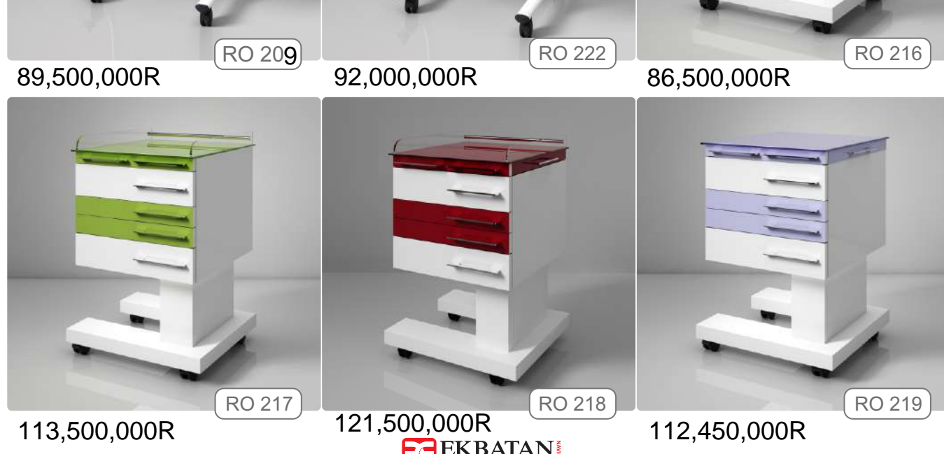
116,000,000R RO 210 102,600,000R RO 215 105,500,000R RO 211 102,600,000R RO 212 114,500,000R RO 213 89,000,000R RO 214 89,500,000R RO 209 92,000,000R RO 222 86,500,000R RO 216 113,500,000R RO 217 121,500,000R RO 218 112,450,000R RO 219